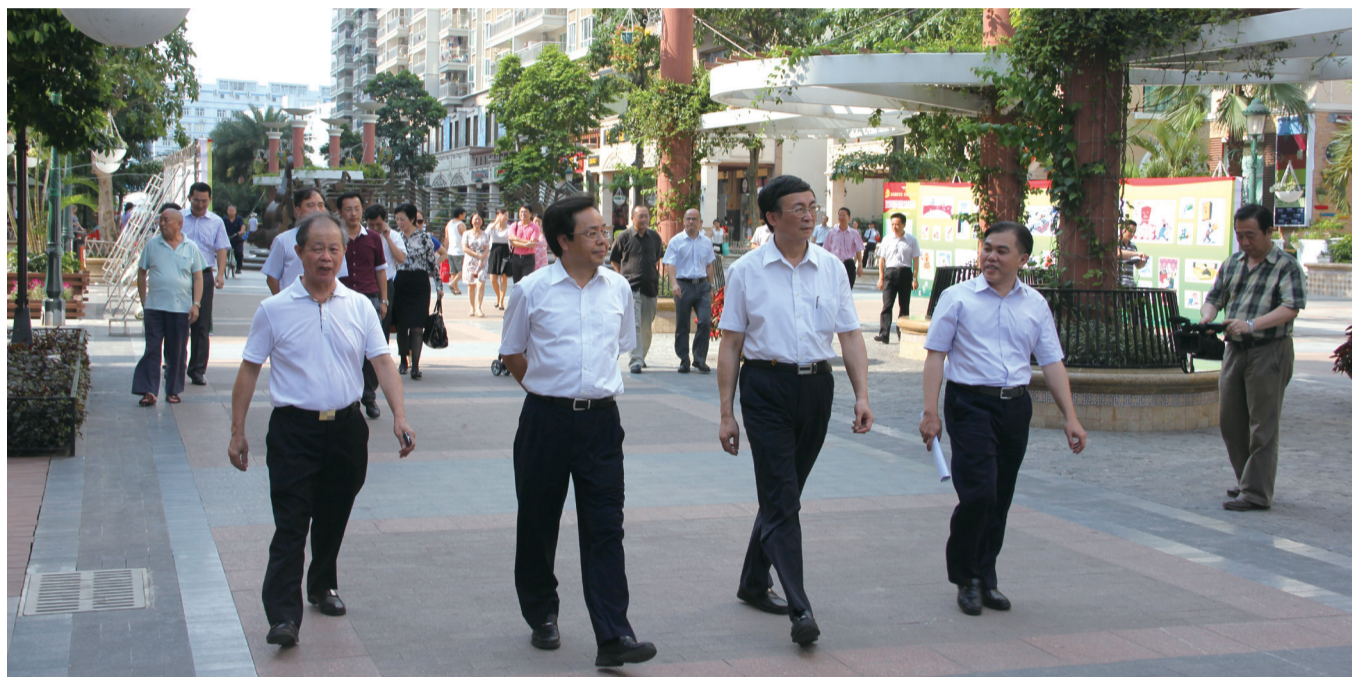
注: 纪委书记丘海(左三)在视察过程中指出花伴里改造的366大街是西丽片区旧改的典范

花伴里人生讯 随着经济特区建设的不断深化和完善,西丽已然成为特区重要窗口。市政府及街道部门对不断改善和提高西丽社区居民生活环境和品质极为重视。2013年6月20日下午,深圳市委常委、纪委书记丘海等一行领导莅临366大街视察工作。陪同人有区委副书记李小甘书记、街道办事处严明书记、新围村村长刘绍华等领导。