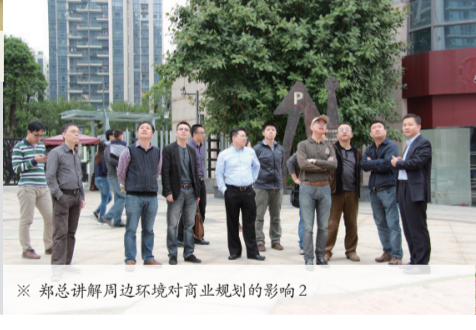
※ 郑总讲解周边环境对商业规划的影响2

在矩阵式管理模式下，跨部门之间的资源分享合作尤为重要。目前，集团的地产项目管理模式处于转型关键期，这个过程将面临很多挑战，需要大家形成共识，共同应对解决。商管中心在近期联合设计、营销、运营、人力等职能中心，举行了一场社区商业开发案例分享会，共计38人次参加了培训。