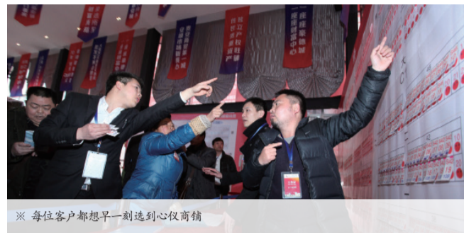
※ 每位客户都想早一刻选到心仪商铺

安顺国际商贸物流城项目自2013年10月18日开工建设,2014年1月16日开盘销售。在项目全体员工辛勤努力下,目前首期推出的1006套商铺,于4月28日已正式突破700套销售大关!在此,花伴里集团向广大客户和所有做出贡献的员工表示衷心的感谢!让我们共同努力,再创佳绩!