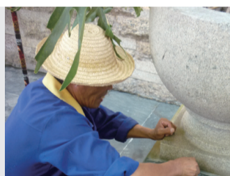
※ 清洁人员清理大理石