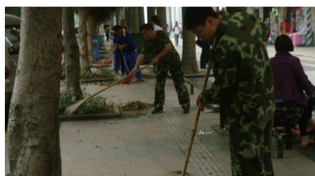
※ 管理处全员参与清理商业街垃圾