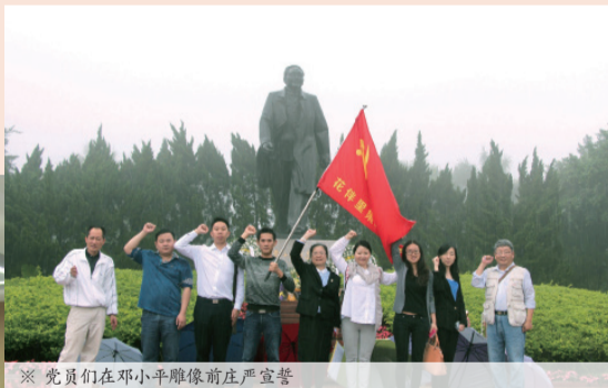
※ 党员们在邓小平雕像前庄严宣誓