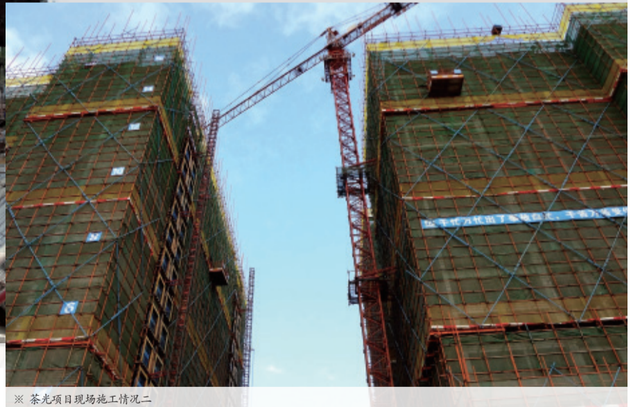
※ 茶光项目现场施工情况二