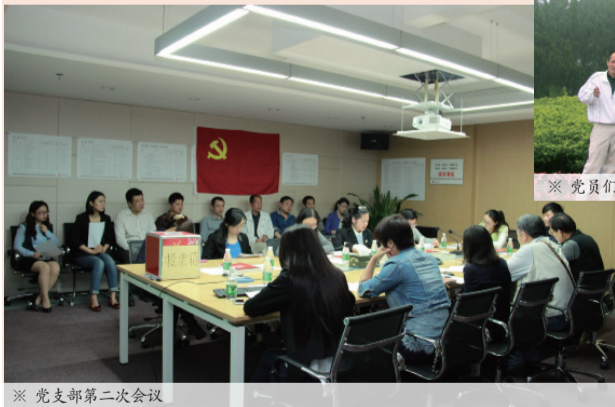
※ 党支部第二次会议