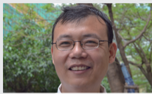
※ 安管也可以很温柔