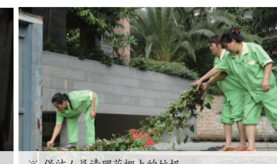
※ 保洁人员清理花棚上的垃圾