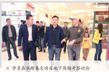
※ 学员在水榭春天项目地下商辅考察讨论