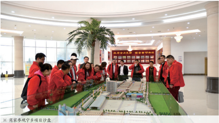
※ 商家参观宁乡项目沙盘