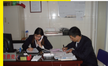
※ 热情接听客户电话