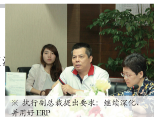
※ 执行副总裁提出要求:继续深化、并用好ERP

花伴里人生讯 2014年4月19日,花伴里集团迎来了一个新的历史时刻:总裁办公会正式启用“ERP线上汇报”的方式来检查、督促各单位的工作。深圳区域各项目组、职能中心均在会上通过ERP汇报双周计划和工作进度。这是花伴里集团标准化建设的一个里程碑式的进步,标志着各项工作在向规范、高效、有序管控等方面做向前发展一步: