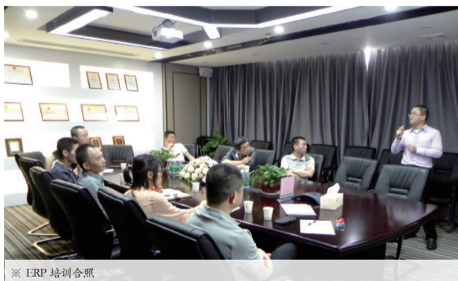
※ ERP 培训合照

根据集团要求，ERP系统将成为一种全新的管理工具，结合矩阵式管理模式，使其在生产管理过程更加高效，集团有计划的对各公司进行ERP系统培训。