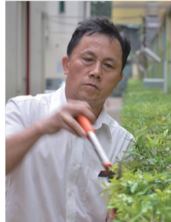
※ 认真修剪，给业主们打造一个最美的小区花园