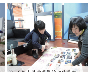
※ 工作人员为社区活动作总结