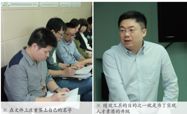
※ 在文件上庄重写上自己的名字

培训过后，人力中心对参训人员组织了考试，参训人员加深了对绩效管理及激励机制的理解，明晰了只有个人做好本职工作，加强团队合作才能打造出优秀团队的工作理念。