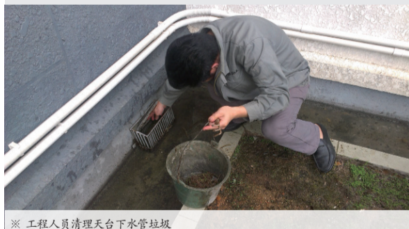
※ 工程人员清理天台下水管垃圾