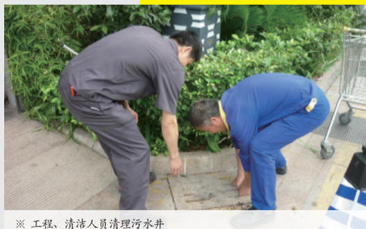
※ 工程、清洁人员清理污水井