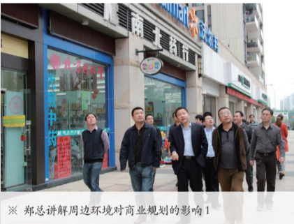
※ 郑总讲解周边环境对商业规划的影响1